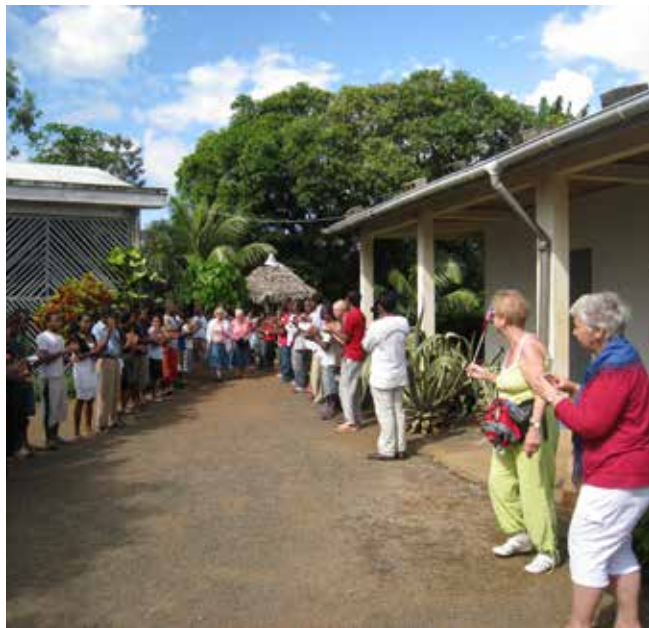
Vi ble godt mottatt på Fihaonana på 17. mai.